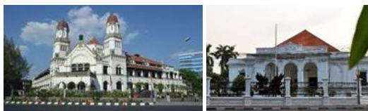
Gambar 5. Ini bangunan bersejarah di Indonesia yang menggunakan gaya Indische Empire Style