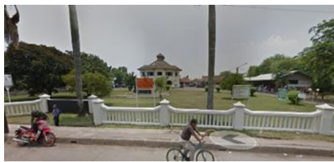
Gambar 1. Kondisi gedung juang 45 sebelum direvitalisasi pada tahun 2013

Museum sebagai ruang publik memiliki peran strategis dalam melestarikan sejarah, pendidikan, dan identitas budaya. Di Indonesia, banyak museum yang menempati bangunan cagar budaya, sehingga menghadapi tantangan ganda: menjaga keaslian arsitektur sekaligus memenuhi kebutuhan sosial masyarakat modern (Setiadi, 2016; Anggraeni, 2014). Salah satu contohnya adalah Museum Gedung Juang 45 Tambun Kabupaten Bekasi, yang awalnya dikenal sebagai Landhuis Tamboen dengan gaya arsitektur Indische Empire Style abad ke-19 (Wahyudi, 2018).