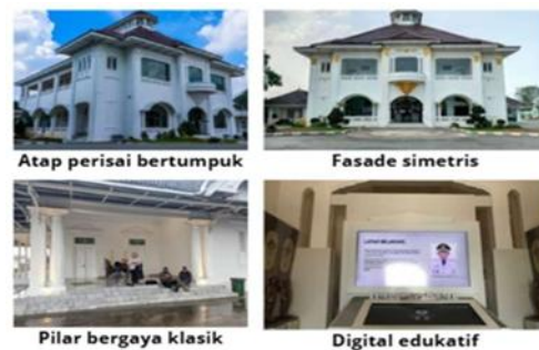
Gambar 12. Spasial Khas Indische Empire Style

bersejarah dapat terus hidup apabila fungsi dan konteks penggunaannya diperbarui secara sensitif terhadap karakter aslinya.