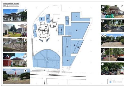
Gambar 8. Kondisi dan tata ruang luar Gedung Juang Sesudah di Revitalisasi

memperlihatkan keterlibatan aktif pengunjung dalam proses pembelajaran yang lebih interaktif. Hal ini sesuai dengan pandangan Yulianto (2015) yang menyebutkan bahwa museum modern berfungsi sebagai ruang belajar partisipatif yang menumbuhkan rasa ingin tahu dan kesadaran sejarah melalui pengalaman langsung.