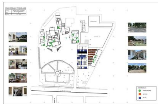
Gambar 10. Pengamatan Pola Perilaku Pengunjung saat jam 11.00 – 14.00 WIB