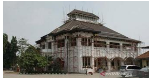
Gambar 6. Kondisi saat sedang di revitalisasi Gedung Juang Bekasi

Revitalisasi merupakan proses menghidupkan kembali fungsi bangunan atau kawasan bersejarah agar tetap relevan dengan kebutuhan masa kini (Anggraeni, 2014). Menurut Departemen Pendidikan dan Kebudayaan (1996), revitalisasi tidak hanya berfokus pada pemugaran fisik, tetapi juga pengembangan fungsi sosial, ekonomi, dan budaya.