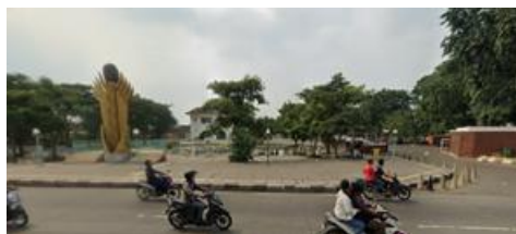
Gambar 2. Kondisi gedung juang 45 sesudah di revitalisasi pada tahun 2025

Revitalisasi besar-besaran pada tahun 2020-2021 dengan anggaran Rp36 miliar mengubah fungsi museum dari bangunan terbengkalai menjadi pusat edukasi sejarah berbasis digital dan destinasi wisata budaya (Karina, 2021). Upaya ini sejalan dengan UU No. 11 Tahun 2010 tentang Cagar Budaya serta prinsip adaptive reuse yang menyeimbangkan pelestarian fisik dengan pemanfaatan fungsional (Hapsoro, 2010). Pasca-revitalisasi, ruang dalam museum kini berfungsi sebagai galeri edukatif dengan pameran multimedia, sementara ruang luar berkembang menjadi arena publik untuk konser, pameran komunitas, dan aktivitas rekreasi (Yulianto, 2015).