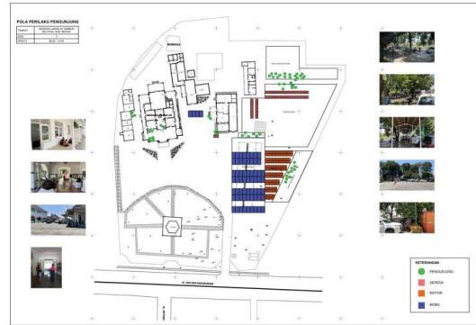
Gambar 9. Pengamatan Pola Perilaku Pengunjung saat jam 06.00 – 10.00 WIB

memperluas jangkauan pengunjung, termasuk generasi muda yang sebelumnya kurang tertarik dengan museum sejarah. Kini, museum tidak hanya menjadi tempat belajar sejarah, tetapi juga ruang ekspresi budaya dan kegiatan komunitas yang memperkuat identitas lokal.