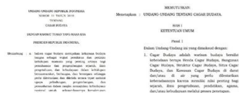
Gambar 3. Bunyi UU RI Nomer 11 Tahun 2010 ( Tentang Cagar Budaya )

Menurut Undang-Undang Republik Indonesia Nomor 11 Tahun 2010 tentang Cagar Budaya, cagar budaya merupakan warisan budaya bersifat kebendaan berupa bangunan, struktur, situs, dan kawasan yang memiliki nilai penting bagi sejarah, ilmu pengetahuan, pendidikan, agama, dan kebudayaan. Arifin (2007) menegaskan bahwa pelestarian cagar budaya tidak hanya berfokus pada aspek fisik, tetapi juga makna sosial dan kultural yang melekat pada bangunan tersebut.