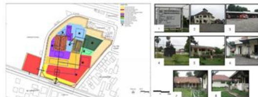
Gambar 7. Kondisi Gedung Juang Sebelum Revitalisasi

Revitalisasi Museum Gedung Juang 45 Tambun Kabupaten Bekasi telah membawa perubahan besar terhadap fungsi ruang dan pola perilaku penggunaannya. Sebelum revitalisasi, bangunan bergaya Indische Empire Style ini dikenal sebagai salah satu peninggalan kolonial yang terbengkalai dan jarang dikunjungi masyarakat. Kondisinya yang kusam dan minim kegiatan menjadikan museum hanya berfungsi sebagai monumen sejarah yang pasif. Setelah dilakukan revitalisasi pada tahun 2020–2021 dengan biaya sekitar Rp36,9 miliar, Gedung Juang 45 tampil sebagai ruang publik yang modern, interaktif, dan inklusif. Pemerintah Kabupaten Bekasi mengubah fungsi museum ini menjadi pusat edukasi sejarah berbasis digital dengan fasilitas tambahan seperti ruang pameran multimedia, amphitheater, taman interaktif, dan area komersial.