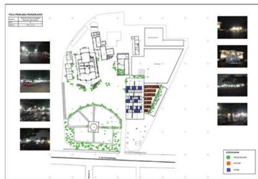
Gambar 11. Pengamatan Pola Perilaku Pengunjung saat jam 18.00 – 20.00 WIB

Dari sisi sosial dan ekonomi, perubahan perilaku pengunjung juga memberikan dampak positif terhadap lingkungan sekitar. Aktivitas publik di museum